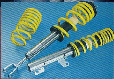
Gewindefahrwerk adjustable suspension aus Edelstahl, Tieferlegung in stainless steel, lowering VA: bis max. 65 mm FA: to max. 65 mm HA: bis max. 55 mm RA: to max. 55 mm Sportfedersatz sports springs Tieferlegung ca. 30 mm lowering approx. 30 mm